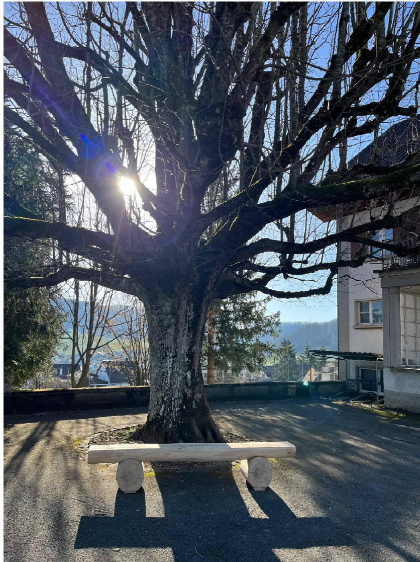
Das neue „Bänkli“ beim alten Schulhaus in Känerkinden